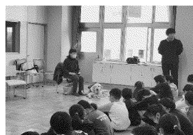
小学生の福祉教育