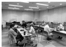
困基ボランティア活動風景