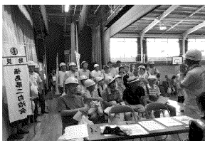
災害ボランティア センター 立ち上げ訓練