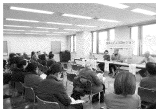
ボランティアフェスティバル (パネルディスカッション)