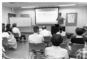
手話講習会 (聞こえない方の話を聞く会)