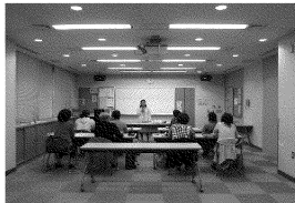
協力会員養成講習会

①ファミリー・サポート・センター事業 事業費合計 6,851,000円 子育てを手伝っていただける方と、子育ての手助けが必要な方を会員とする、地域で支え合う「子育て支援ネットワーク」の充実に努めます。