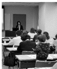
プロから学ぶ 「そうじのこつ」講座

高齢者の方、障害のある方、援助の必要な方など幅広い対象者の方に、家事援助サービスを提供します。