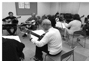
音楽ボランティア活動 (ギターサークル響)